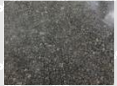
防草剤ウィードバリア

ウィードバリアは木質灰を原料とした防草剤です。安全な成分で構成されており低環境負荷型の防草処置を可能とします。