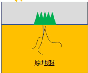
日光遮断による 成長阻害