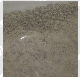
防草剤ウィードバリア

ウィードバリアは木質灰を原料とした防草剤です。 安全な成分で構成されており低環境負荷型の防草処置を可能とします。